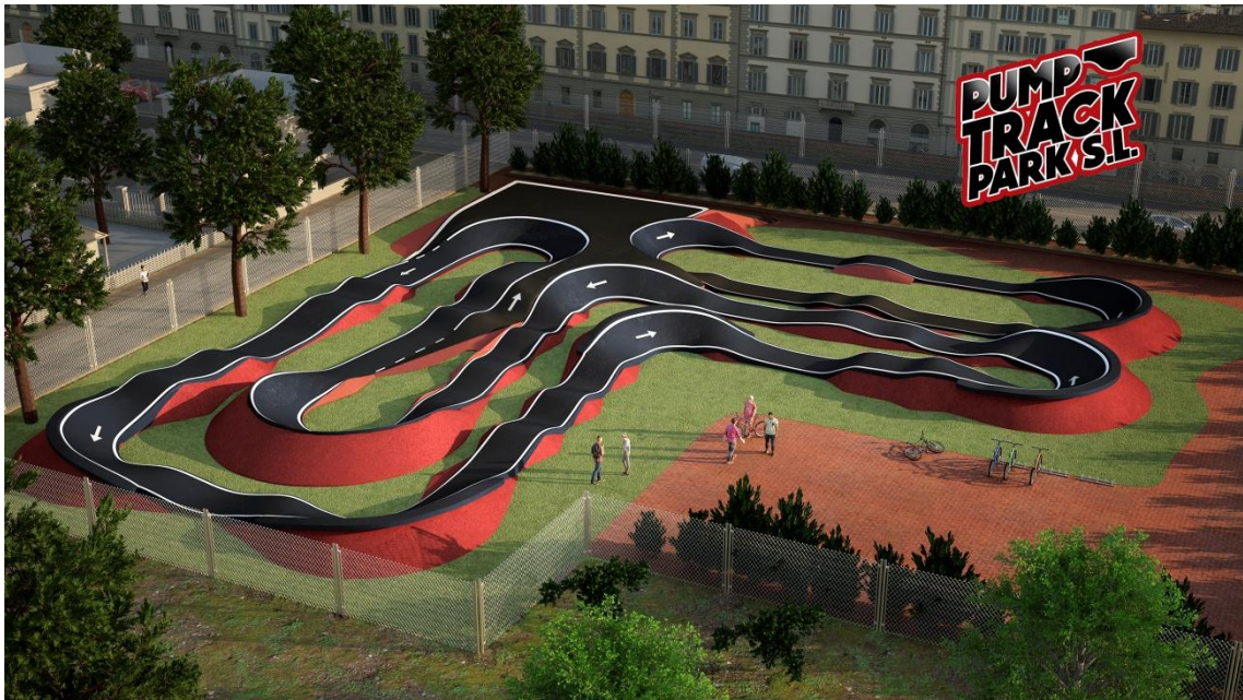
Exemple Pumtrack 1.200m2 acabat premium plus 108.000 eurs + iva